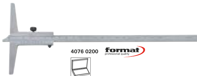
4076 0200 format professional quality