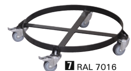
7 RAL 7016