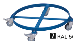
7 RAL 5010