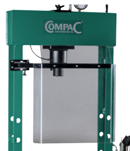
Schutzgitter für 20–25 t