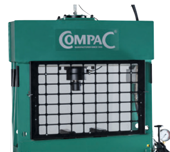
Schutzgitter für 40–100 t