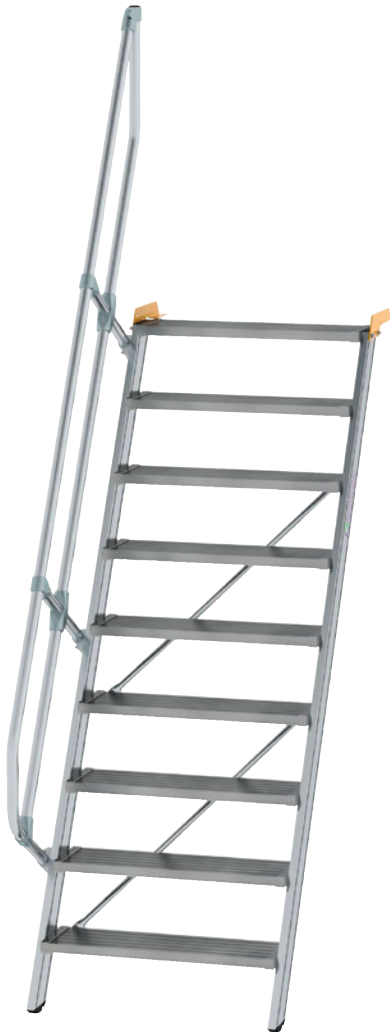
Abb. zeigt Treppe mit Handlauf.

• Belastbare Industrieausführung Ortsfeste Treppe aus Aluminium mit Neigung 60°. Stufenbreiten: 600, 800 und 1000 mm. Maximale Stufenbelastung 150 kg, Gesamtbelastung 300 kg.