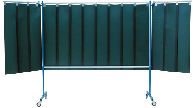
Fahrbare Schutzwand, Lamellenausführung, 3-teilig.